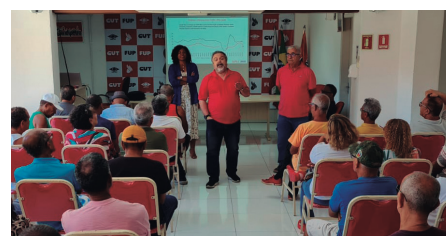
Aposentados e pensionistas participam de confraternização em Salvador e Alagoinhas