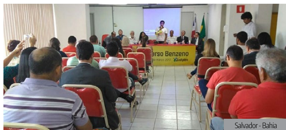
Salvador - Bahia

Com 77 inscritos, O II Curso sobre o Benzeno, realizado pela secretaria de SMS do Sindipetro Bahia, detalhou a forma de se fazer o programa de prevenção da exposição ocupacional ao benzeno (PPEOB), assim como todas as atribuições do GTB, ressaltando a importância da formação do Grupo de Trabalhadores Representantes do Benzeno (GTB), para atuar no próprio local de trabalho, como forma de tornar mais efetiva a prevenção à exposição a esse agente cancerígeno.