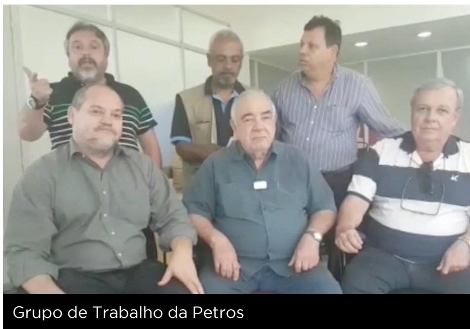
Grupo de Trabalho da Petros

Em reunião realizada dia 29/12 - na Sede da Petros, no Rio de Janeiro, com o presidente da Fundação - o Grupo de Trabalho (GT Petros), composto pelos representantes das entidades sindicais, Petrobrás e Petros, apresentou sua proposta alternativa ao atual PED - Plano de Equacionamento de Déficit - dos Planos Petros Repactuados e Não Repactuados (PPSP-R e PPSP-NR) e cobrou prioridade na sua implementação.